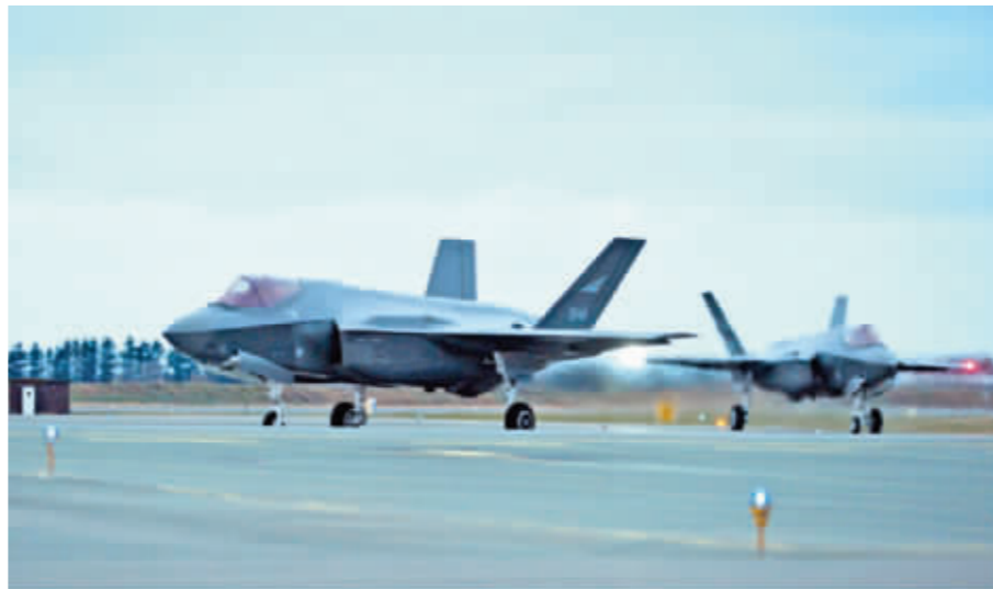
三架F-35战斗机抵达挪威厄兰空军基地。

据新华社电 据挪威国家电视台3日报道,3架F-35战斗机当天下午抵达位于挪威中部的厄兰空军基地。这是挪威购买的F-35战斗机首次抵达该国。