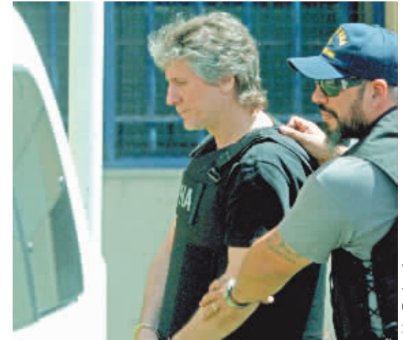
阿根廷前副总统阿马多·布杜(左)被警方逮捕。

新华社电 阿根廷联邦法院3日正式对前副总统阿马多·布杜发出逮捕令,原因是布杜涉嫌干涉政府对三起洗钱活动和非法组织的调查。