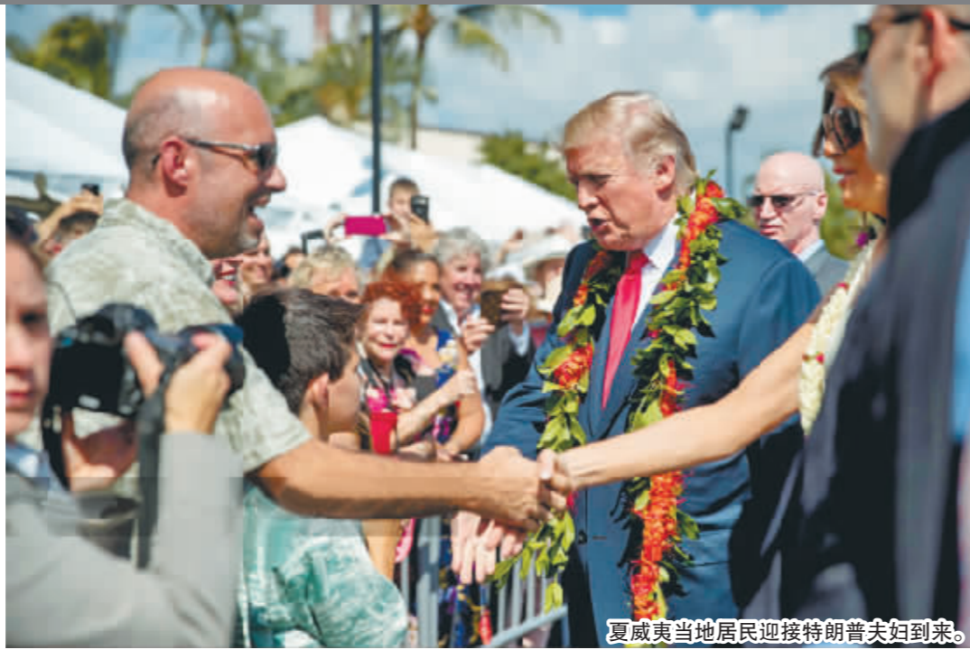
夏威夷当地居民迎接特朗普夫妇到来。

特朗普将在当地时间4日启程赴日本,随后将前往韩国、中国、越南和菲律宾,共计11天。