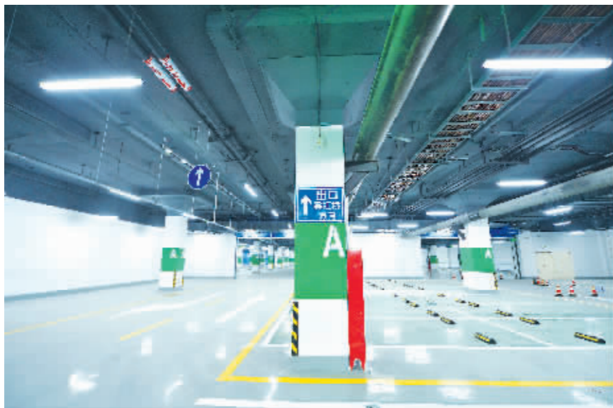
新投用的哈站北广场地下停车场。

关部门决定暂时只允许出租车进入地下停车场接送旅客。待地下交通组织方案调整后,视出租车运行情况,确定社会车辆进入地下停车场的时间。现社会车辆暂时利用北广场地面停车场接送旅客。