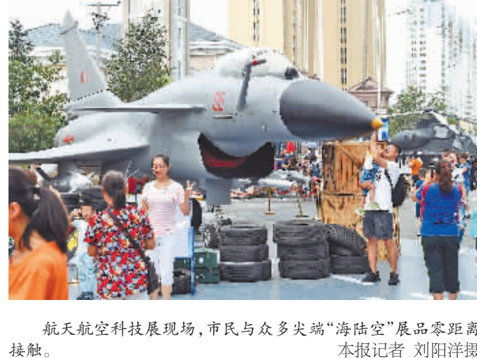
航天航空科技展现场,市民与众多尖端“海陆空”展品零距离接触。

说,儿子今年15岁,让他多接触接触这样的爱国主义国防知识普及活动,有利于他的成长与价值观的建立。